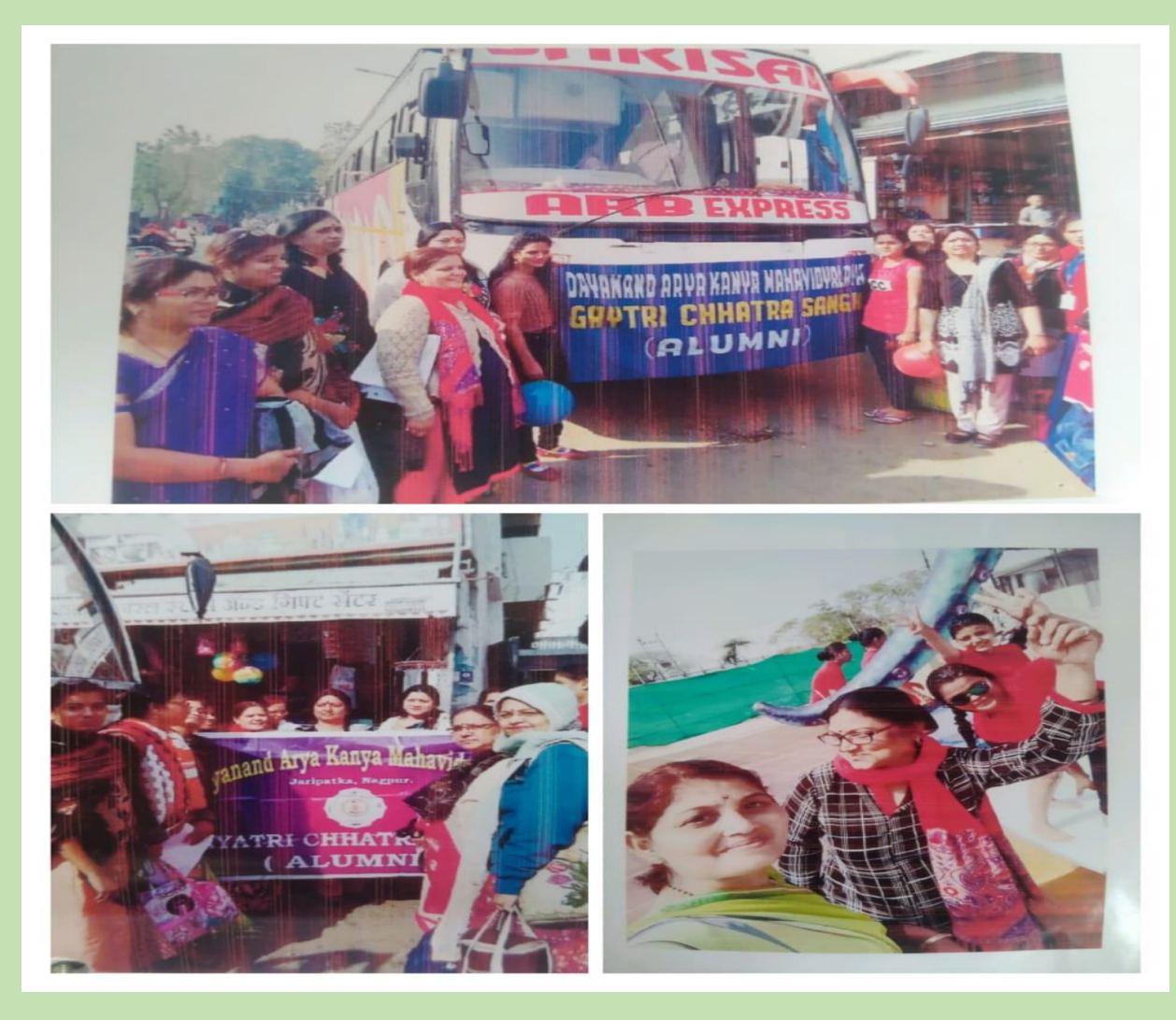
ALUMNI MEET WITH PRINCIPAL MADAM 6-1-2022